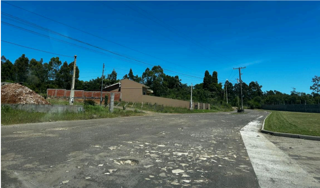
Figura 1: Rua Syllas Pauler (1/4).