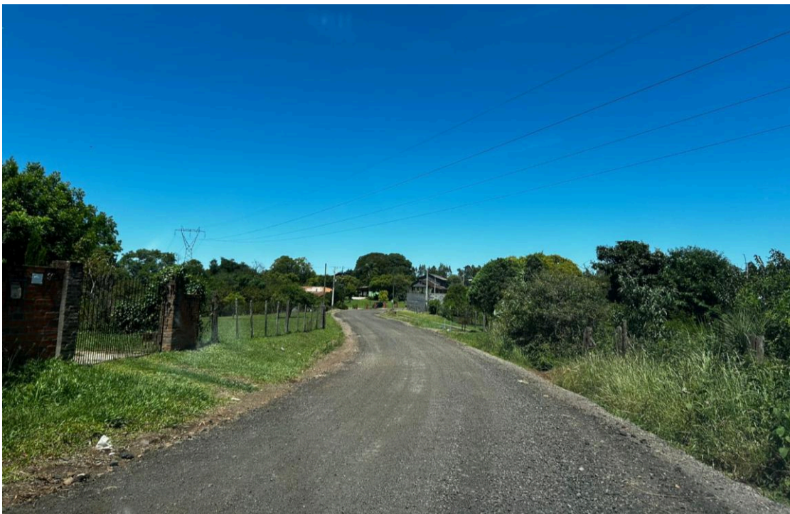
Figura 2: Rua Syllas Pauler (2/4).

Fonte: Setor de Engenharia e Projetos – PMI, 2025.