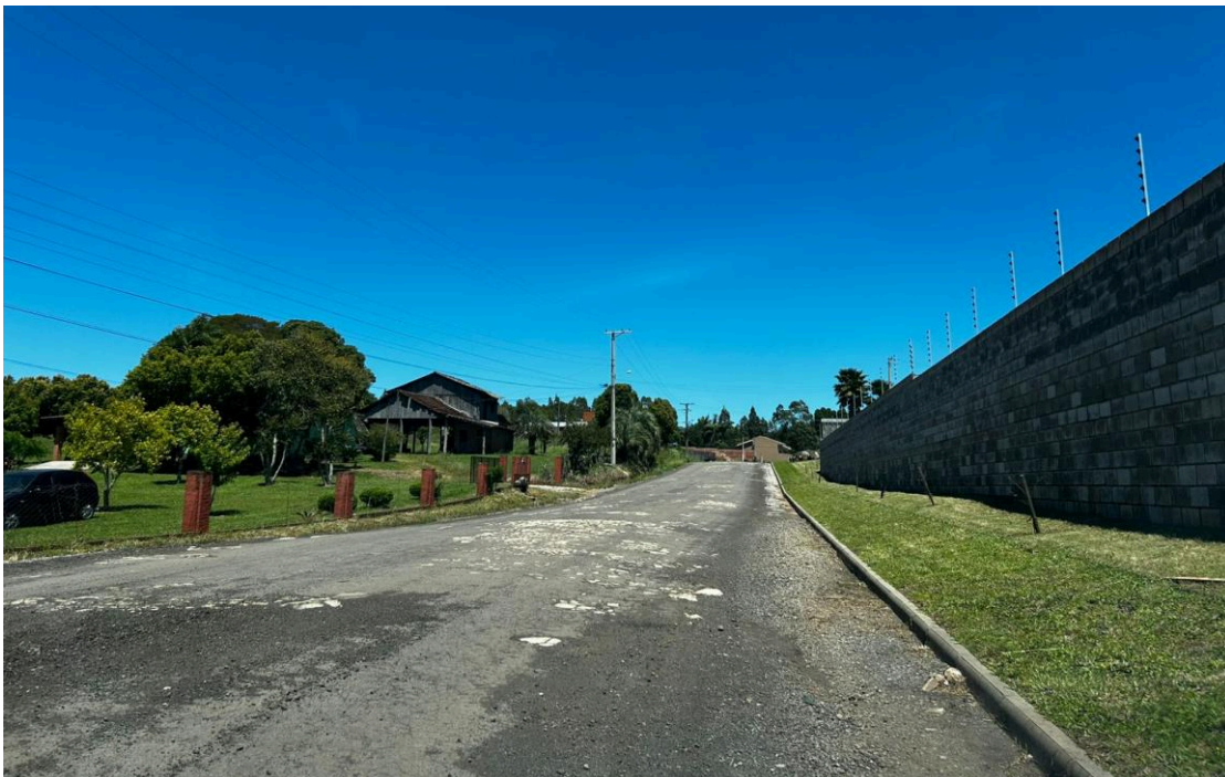
Figura 4: Rua Syllas Pauler (4/4).